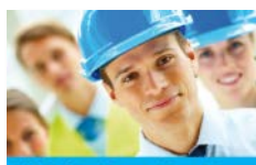
VOB für (Jung-)Bauleiter