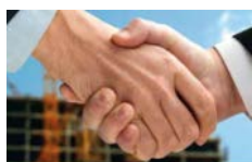
Ausgleichsberechnung BGK AGK